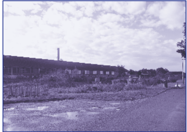
De oude crossbaan verkeert in slechte staat.

Actie: Komt in de Wijkkrant van april 2015.